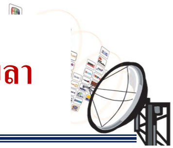
ร้อยละผลการตรวจสอบเฝ้าระวังโฆษณาผิดกฎหมาย